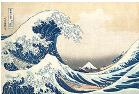
Grande Vague, Kanagawa 1830