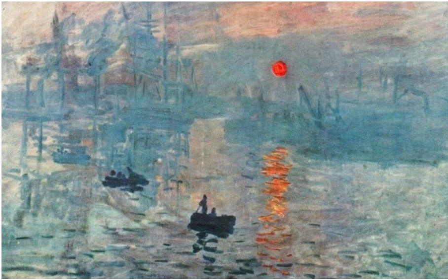
Impression, soleil levant, Monet 1872