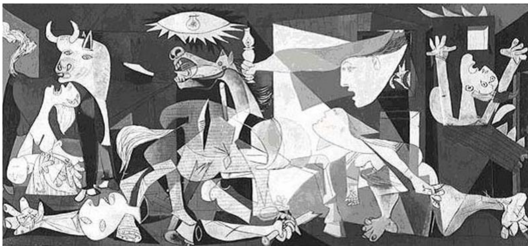
Guernica, Picasso 1937