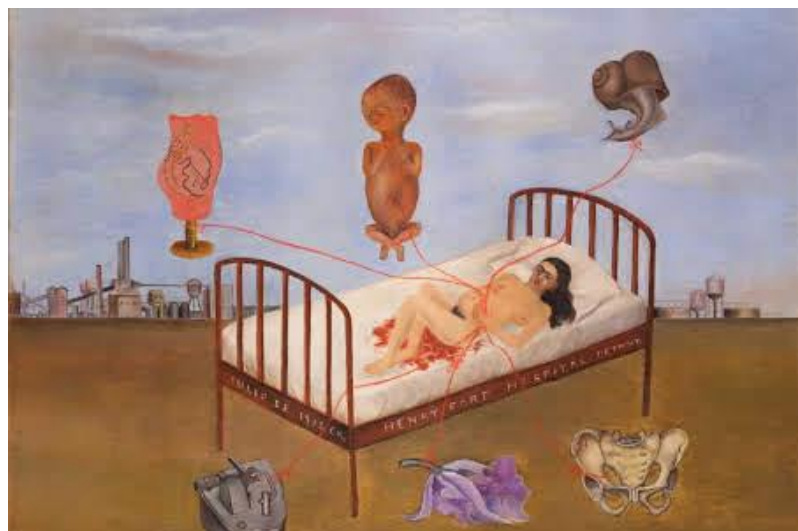
L'Hôpital Henry Ford, Kahlo 1932