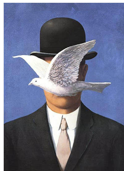
L'Homme au chapeau melon, Magritte 1964