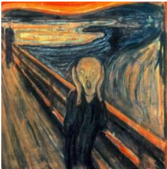
Le Cri, Munch 1893