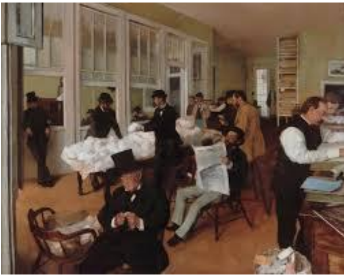
Le Bureau de coton à la Nouvelle-Orléans, Degas 1873