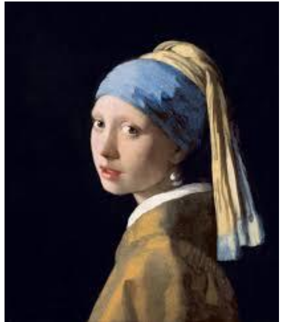
La Jeune Fille à la perle, Vermeer 1665