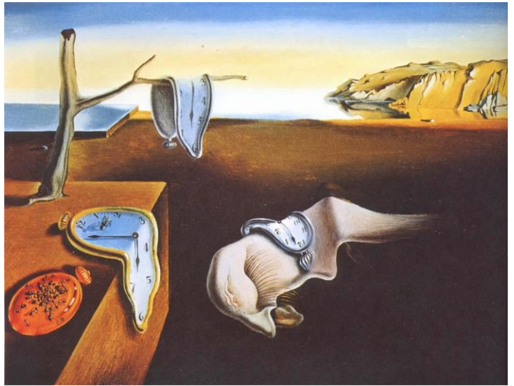
La Persistance de la Mémoire, Dali 1931