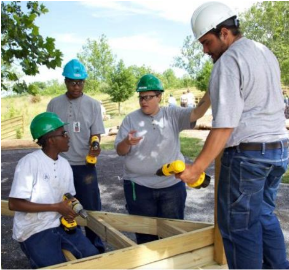
Ils présentent un travail principalement manuel: